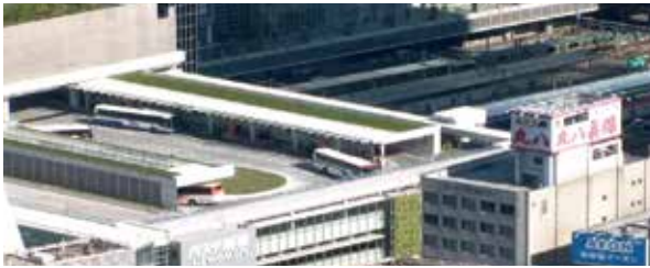
屋上カメラから見た新宿駅方面